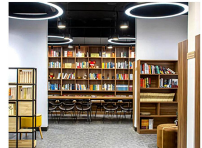
80家学生社团入驻总面积5000余平米的六大书院社区,健康向上、格调高雅、形式多样的社团活动在书院社区

关注、关心、关爱青年学生,倾听青年学生心声,服务学生成长发展,是北理工党委一直坚持贯彻的重要青年工作方针。近年来,学校党委进一步贯彻落实习近平总书记围绕学生、关照学生、服务学生的重要指示要求,紧扣服务青年的工作主线,带领共青团组织不断巩固和扩大党执政的青年群众基础,努力做值得青年学生信赖的贴心人。