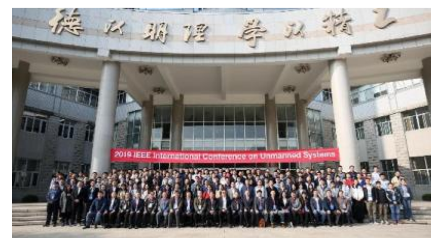
无人系统国际会议