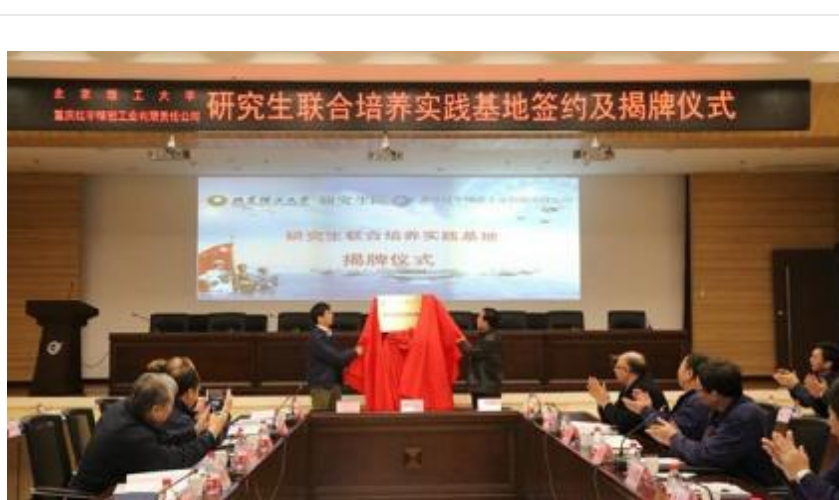
北理工与重庆红宇精密工业有限责任公司举行研究生联合培养实践基地签约和揭牌仪式

传承“红色基因”，砥砺“军工品格”，树立“报国志向”，为党为国精雕细琢又红又专的一流人才，兵器学科使命在肩、奋斗不辍。